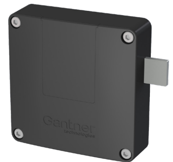
GAT ECO.Lock 71x2

Das robuste Schloss speichert die letzten 150 Buchungen und garantiert eine absolut zuverlässige Datenübertragung. Zudem ist definierbar, ob der Nutzer nur einen einzigen Schrank oder mehrere Schränke belegen kann. Und da für die Verwaltung einer GAT ECO.Lock Schrankschließlösung kein Administrationsaufwand anfällt (keine Schlüsselverwaltung) und die Anlage auch autark funktioniert, wird der Personalaufwand minimiert sowie die Verwaltungskosten reduziert. Nicht zuletzt deshalb, weil die Schlösser absolut intuitiv bedient werden und anhand der Drückerposition sofort ersichtlich ist, welche Schränke frei bzw. belegt sind.